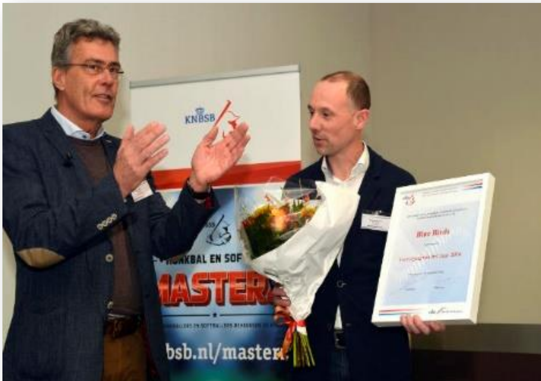
Vereniging van het Jaar (2016)

Voor alle vertrouwenscontactpersonen worden jaarlijks diverse bijeenkomsten en workshops georganiseerd door de NOC*NSF om ervaringen te delen en kennis te vergaren.